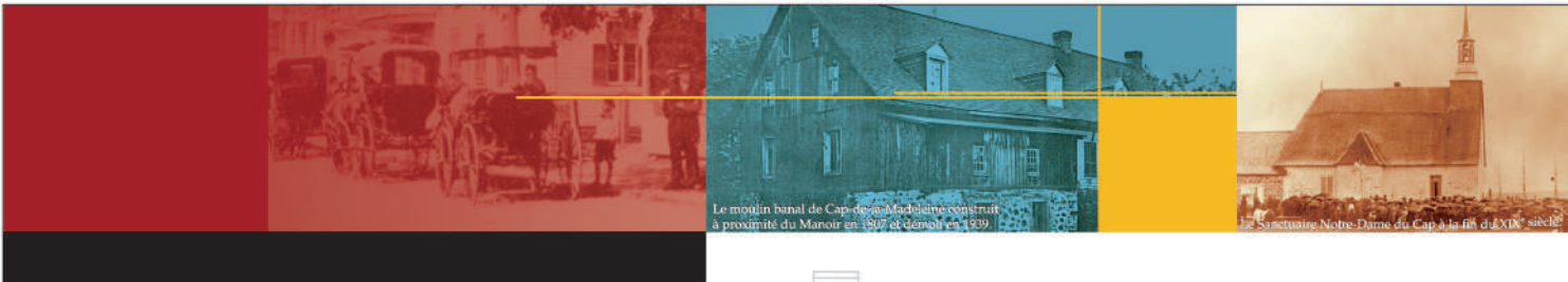
Le moulin banal de Cap-de-la-Madeleine construit à proximité du Manoir en 1807 et démolit en 1939.