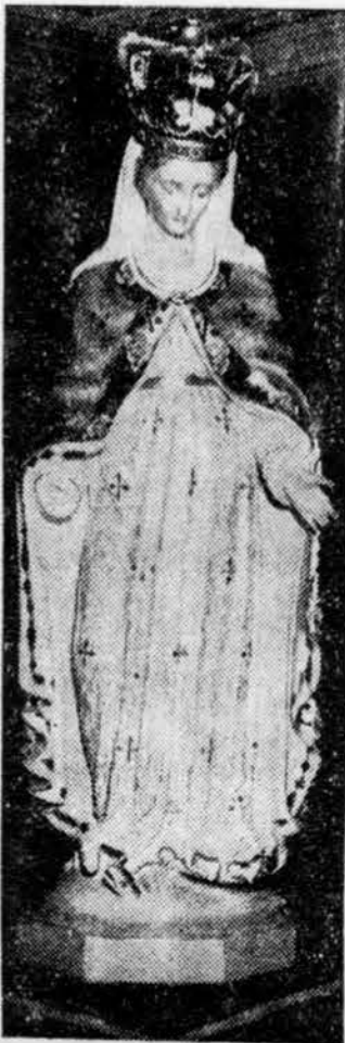
La réplique mystérieuse

De deux façons, toutefois, on ne s'explique pas comment ils ont pu tromper la surveillance de nombreux policiers qui patrouillent sans cesse la montagne, à cheval. Et cela ne fait évidemment qu'ajouter au