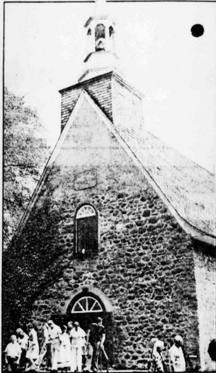
Érigée en 1714, la petite église du Cap-de-la-Madeleine est reconnue comme la plus vieille église du Canada. Elle est construite en pierres des champs.

L'évêque de Rouyn-Noranda souligne qu'il n'a rien contre les saints et les saintes officiellement reconnus par l'Église. Mais il fait cette confidence: «Je ne vous cache pas que je me sens mal à l'aise quand je m'aperçois que dans la liste des saints et des saintes qui sont proposés à notre prière, à notre intercession, il y a une majorité de papes, d'évêques, de fondateurs d'ordres religieux, de vierges martyres, etc...» Et il poursuit plus loin: «Mais n'oublie-t-on pas trop facilement les saintes et les saints de tous les jours: nos parents, ces mères de famille qui ne ménagent ni leurs peines ni leurs veilles, ces pères de famille dont chaque nouvelle journée est un acte de foi, ces gens humbles et simples tout dévoués au Seigneur et en service auprès de leurs frères et soeurs, dans le quotidien.»