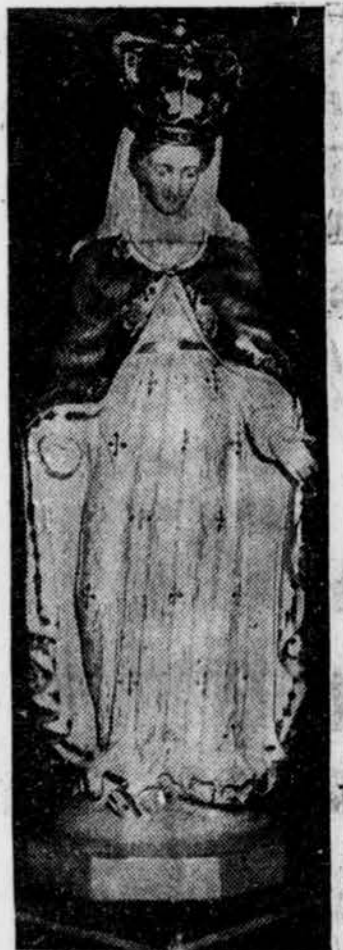
LA VIERGE DU CAP, telle qu'elle apparaissait au moment où elle fut retrouvée dans la Montagne, le 9 novembre dernier.

"L'homme à l'appareil refusa de venir réclamer "son bien" à la police. Il voulait que nous allions nous-mêmes la remettre à l'endroit où nous l'avions recueillie. Inutile de dire que nous n'avons pu prêter guère attention à un tel appel. D'autant plus qu'après avoir fait enquête auprès des statuaires de la ville, on constata qu'aucune statue du genre n'avait été vendue, au cours des deux semaines antérieures. Nous continuons plutôt de croire qu'il s'agit d'un maniaque ou fanatique sur lequel il sera bien difficile de mettre la main."