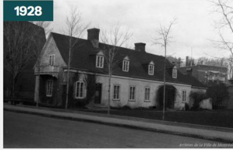
Trois-Rivières : le manoir Boucher de Niverville . - août 1928