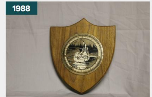
Plaque commémorative de l'Association athlétique des employés de la Wayagamack