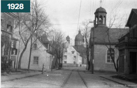
Trois-Rivières / Edgar Gariépy . - août 1928