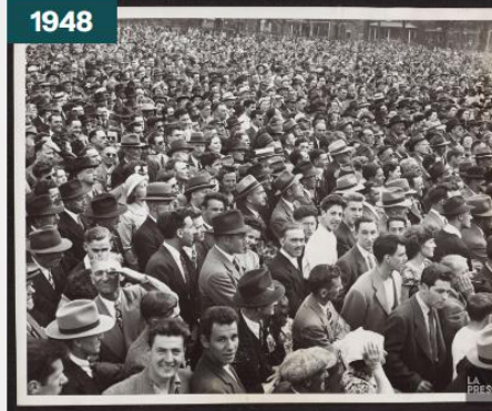
Trois-Rivières, écoles, églises et séminaire, [190-?]-1948