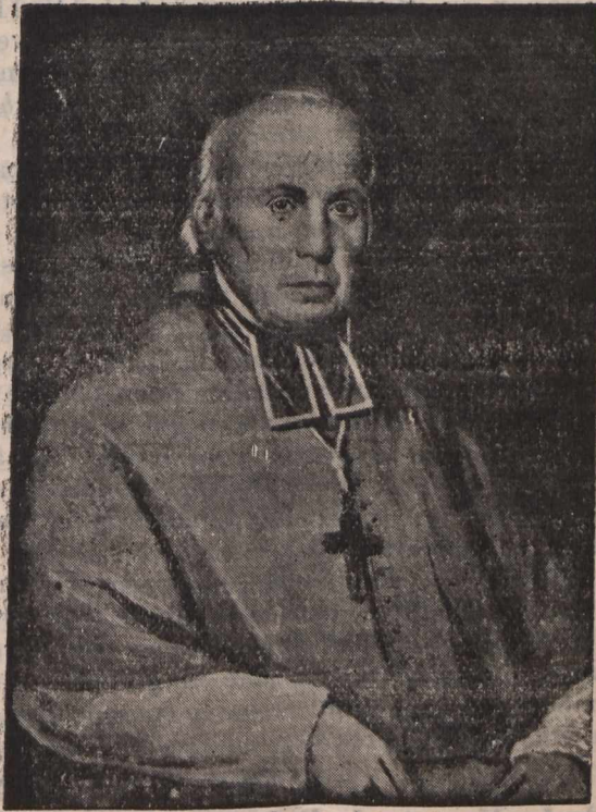
MGR BERNARD-CLAUDE PANET -ARCHEVÊQUE DE QUÉBEC