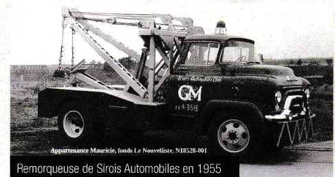
Remorqueuse de Sirois Automobiles en 1955